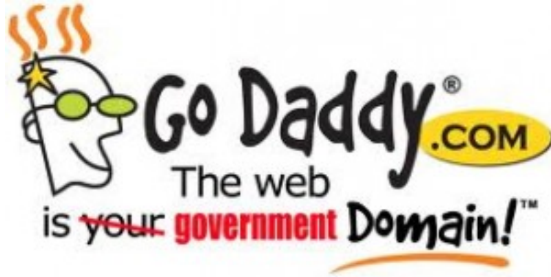
Figure 4.1: Go Daddy

SOPA kısaca internette korsan içerikleri engellemek için çıkartılmaya çalışılan bir yasadır. Bu yasa sayesinde yasadışı materyallerin bulunduğu sitelere erişim yasağı getirebilme yetkisi geliyor. ABD’de görüşülen bu yasa tasarısı kabul edilip kanunlaşması halinde dünya çapında büyük bir sansür gerçekleşeceği iddia ediliyor. Çünkü bu yasa kapsamında yalnızca ABD’deki siteler değil diğer ülke siteleri de engellenebilecek. Bu yasaı savunan ve destekleyen Go Daddy isimli domain şirketi internet kullanıcıları tarafından tepki görmüş olup 100bine yakın kullanıcı domainini başka firmalara taşımıştır. [SOPA]