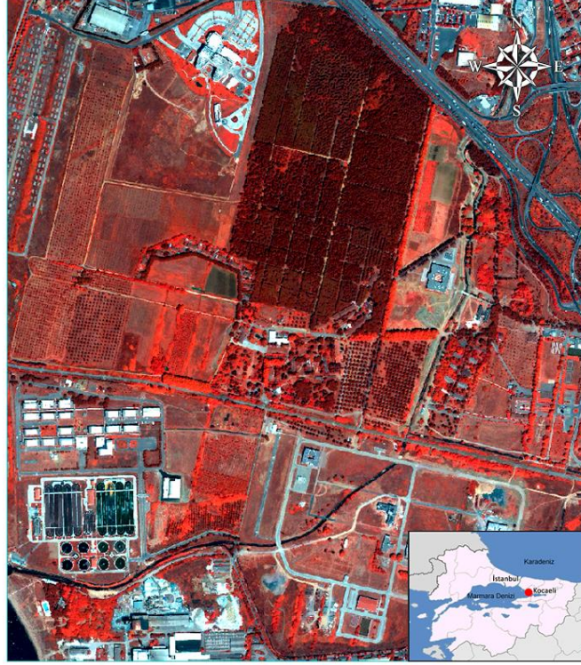
Şekil 1. Çalışma alanının konumu ve uygulamada kullanılan WorldView-2 görüntüsü.