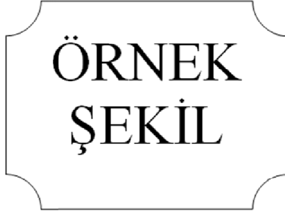
Şekil 6.1: Altıncı bölümde örnek şekil.