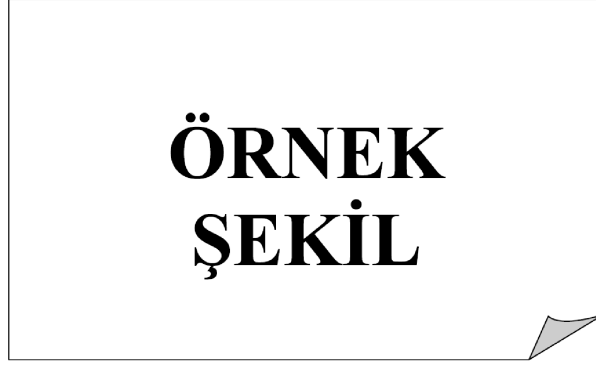
Şekil 3.1: Sinir hücresi, Çetin (2003)’ten uyarlanmıştır.

eos et accusam et justo duo dolores et ea rebum. Stet clita kasd gub rgren, no sea takimata sanctusest Lorem ipsum dolor sit amet, consetetur sadipscing elitr, sed diam nonumy eirmod tempor invidunt ut lab ore sit et dolore magna.